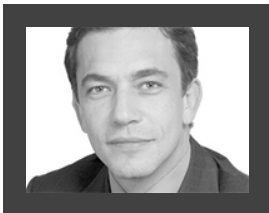
Vincent Lassalle © DR

DGK: Nous ne sommes pas un nouveau venu dans le domaine de l'immobilier. Depuis plus de 20 ans, SBKG & Associés est l'un des principaux cabinets d'avocats d'affaires indépendants avec 31 avocats. Le triptyque - qualité, disponibilité, réactivité - est depuis, sa création, sa marque de fabrique. Le sujet de la rémunération n'est nullement un tabou. La flexibilité et la souplesse font partie de nos options et nous savons travailler dans le cadre d'un forfait pour délivrer la meilleure prestation. Nous entrons dans une période où les avocats vont avoir intérêt à apporter de la valeur ajoutée.